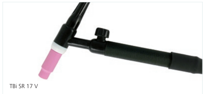
TBi SR 17 V

ТBi WIG/TIG горелка с дополнительной присадочной проволокой TBi system podawania zimnego drutu / TBi systém s chlazeným drátem / TBi sustav za hlađenje žice