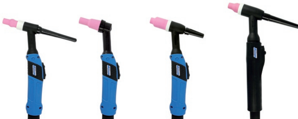
TBi AW 424

Горелки с газовым вентилем / Uchwyt TIG z zaworem / Hořák s ventilem / Gorionik s ventilom