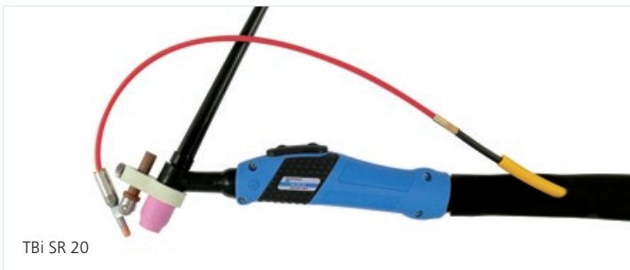
TBi SR 20

P2: Dwudźwigniowy wyłącznik / P2: Dwojpolohová páka / P2: Dvostruki prekidač